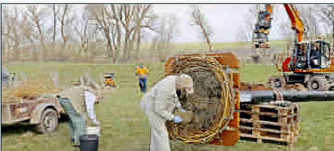
Heu und Äste im Nest befestigen