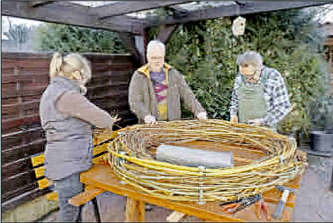
Weidenkorb flechten und befestigen