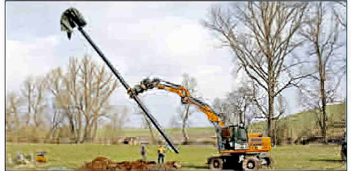
Bagger hebt die Plattform in ein 3 m tiefes Loch