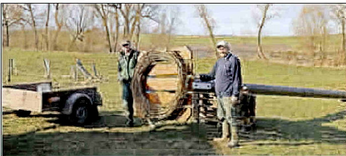
Lärchenbohlen an Stahlkonstruktion verschrauben